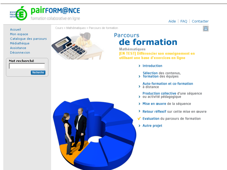
Figure 1. La plate-forme nationale Pairform@nce et les 7 étapes d'un parcours de formation

Pairform@nce mobilise donc principalement trois types d'acteurs : les concepteurs de parcours, les formateurs qui vont concevoir des formations s'appuyant sur ce parcours dans les académies, et enfin les enseignants stagiaires qui vont suivre ces formations et concevoir des ressources pour leurs propres classes. Signalons que sont également impliqués des experts , chargés de valider les parcours avant la mise en ligne de ceux-ci sur la plate-forme nationale. Le dispositif suppose une certaine homogénéité des parcours : ceux-ci doivent être structurés en 7 étapes : entrée dans la formation, sélection des contenus d'enseignement, co et autoformation, conception de situations, mise en œuvre de la situation dans la classe, retour réflexif, évaluation de la formation (fig. 1). Ces 7 étapes, et les ressources à concevoir pour chacune, sont précisées dans un « cahier des charges du concepteur ».