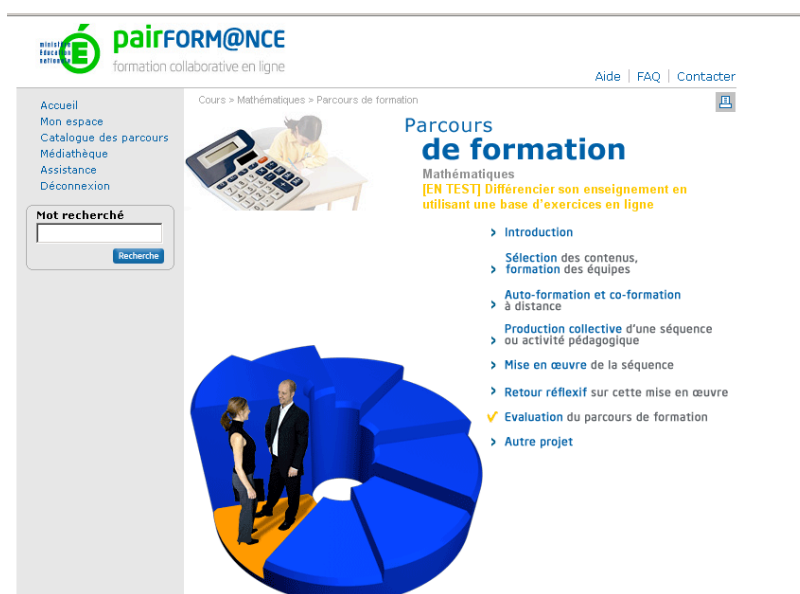
Figure 1. La plate-forme nationale Pairform@nce et les 7 étapes d'un parcours de formation

Pairform@nce mobilise donc trois types d'acteurs : les concepteurs de parcours (qui seront mis en ligne sur une plate-forme nationale après une expertise), les formateurs qui vont concevoir des formations s'appuyant sur ce parcours dans les académies, et enfin les enseignants stagiaires qui vont suivre ces formations et concevoir des ressources pour leurs propres classes. Le dispositif suppose une certaine homogénéité des parcours : ceux-ci doivent être structurés en 7 étapes : entrée dans la formation, sélection des contenus d'enseignement, co et autoformation, conception de situations, mise en œuvre de la situation dans la classe, retour réflexif, évaluation de la formation (fig. 1). Ces 7 étapes, et les ressources à concevoir pour chacune, sont précisées dans un « cahier des charges du concepteur ».